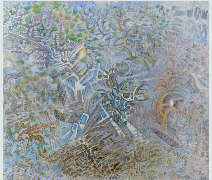
Νίκος Χατζηκυριάκος - Γκίκας, Ο ουρανός 1966, Εθνική Πινακοθήκη

μτφρ. Ζήσιμος Λορεντζάτος Το Βήμα, 16/1/1977